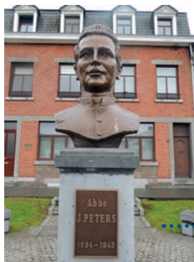
h. Place du Parc : buste de l'Abbé Peters, né à Verviers en 1894. Il lutta contre l'action des nazis. Arrêté en 1942, il fut torturé puis décapité.