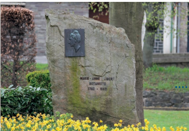
f. Dans le parc des Tanneries : stèle avec médaillon , érigée à la mémoire de la célèbre botaniste Marie-Anne Libert.